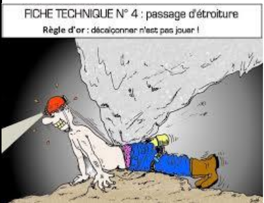
Ça vous rappelle rien ?