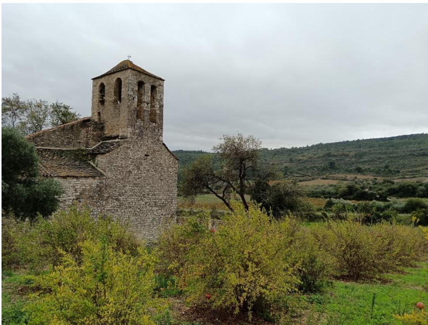
Eglise de La Caunette