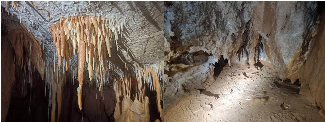
Disque - Balme del Cingle

En résumé ce furent quelques jours bien agréables pour tout le monde. Ceux de l'Isère y ont trouvé des endroits auxquels ils ne s'attendaient pas, ceux du coin aussi parfois... et tout le monde y a trouvé de nouveaux amis sous le signe du partage, de la convivialité, de la simplicité et de la bonne rigolade. Bref que du bon. A refaire...ici, en Isère et ailleurs...peut-être le début d'un concept sympa « ç't'affaire » comme dirait France.