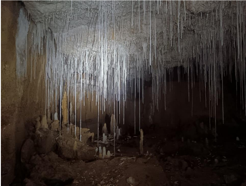
Salle des fistuleuses - Balme del Cingle

Le temps est passé au gris et au crachin, c'est pas grave, sous terre il fait toujours beau... Mika nous a rejoint pour le reste du séjour, tout le monde embarque